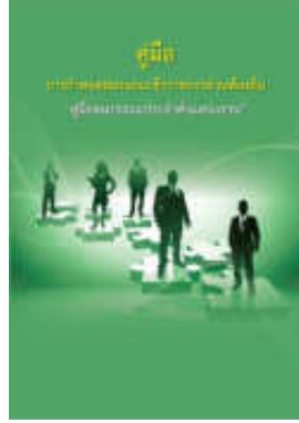
หนังสือ สมรรถนะประจำตำแหน่งงาน