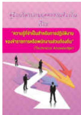
หนังสือ ความรู้ที่จำเป็นสำหรับการปฏิบัติงาน ของข้าราชการหรือพนักงานส่วนท้องถิ่น