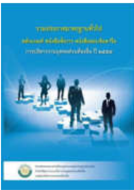
หนังสือ หลักเกณฑ์ หนังสือสั่งการ หนังสือตอบข้อหารือ การบริหารงานบุคคลส่วนท้องถิ่น ปี ๒๕๕๗