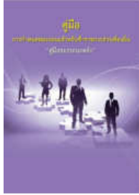
หนังสือ สมรรถนะหลัก