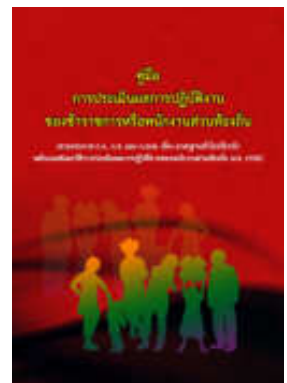
หนังสือ การประเมินผลการปฏิบัติงาน ของข้าราชการหรือพนักงานส่วนท้องถิ่น