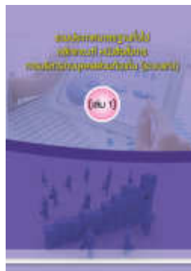
หนังสือ รวมประกาศมาตรฐานทั่วไป หลักเกณฑ์ หนังสือสั่งการ การบริหารงานบุคคลส่วนท้องถิ่น