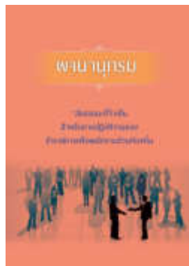
หนังสือ สมรรถนะที่จำเป็นสำหรับการปฏิบัติงานของ ข้าราชการหรือพนักงานส่วนท้องถิ่น