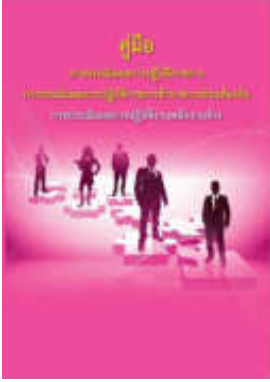
หนังสือ การประเมินผลการปฏิบัติงานพนักงานจ้าง