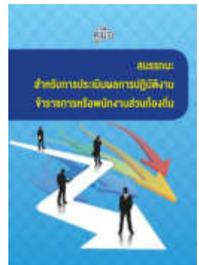
หนังสือ สมรรถนะสำหรับการประเมินผลการปฏิบัติงาน ข้าราชการหรือพนักงานส่วนท้องถิ่น