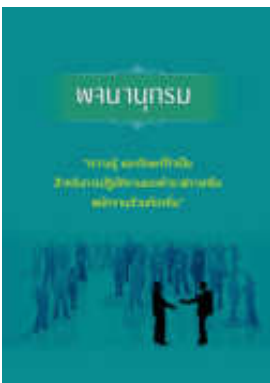
หนังสือ ความรู้ และทักษะที่จำเป็น สำหรับการปฏิบัติ งานของข้าราชการหรือพนักงานส่วนท้องถิ่น