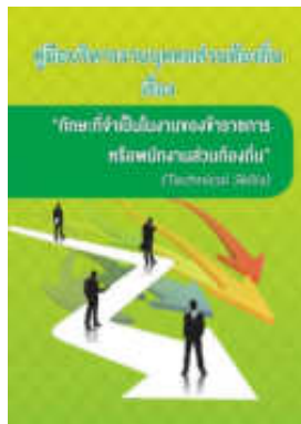
หนังสือ ทักษะที่จำเป็นในงานของข้าราชการ หรือพนักงานส่วนท้องถิ่น